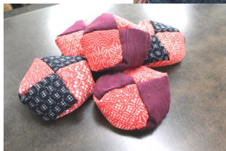
お手玉も人気です