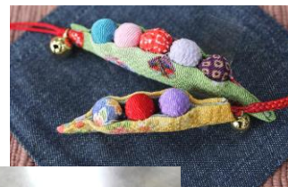
エンドウ豆のストラップ