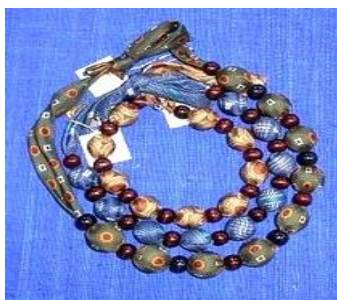
ネクタイをリメイクしたネックレス 結び方で長さが調整できます