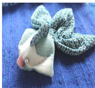
着物地で作った金魚