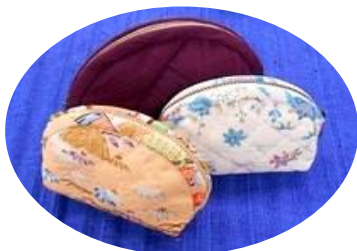
人気の半円ポーチ