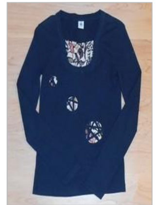
着物地でパッチワークしたシャツ