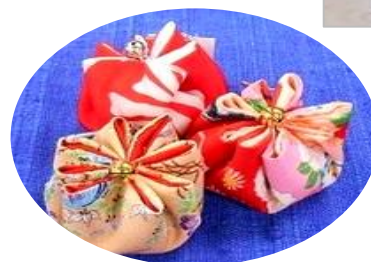
鈴のついたお手玉