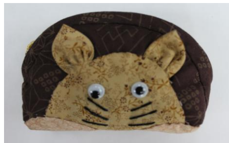
トトロの小物入れ