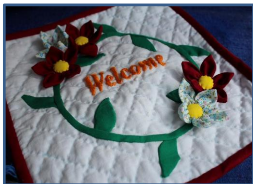
キルティングのウエルカムボード

楕円形の布を2つに折ってファスナーを付けた小物入れです。使う生地をキルティングにしたりアップリケをしたりすることによってシックにも子ども向けにもなります。プレゼントにぴったりです。