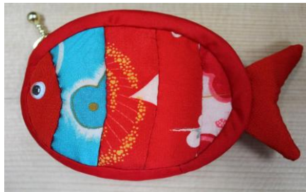
目玉がくるくると動く金魚の小物入れ

リメイクチームでは新しいメンバーも加わり、毎月いろいろなアイデアを出し合って着物地を使った小物や、ベストなどを作っています。作品数も多くなり、ショップでのリメイク品の棚も大きくなりました。リメイク品を楽しみにショップに来て下さる方も増えてきました。